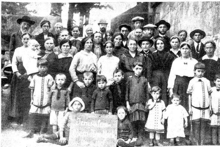
Jüdische Emigranten auf der Reise von Jerusalem nach Amerika.