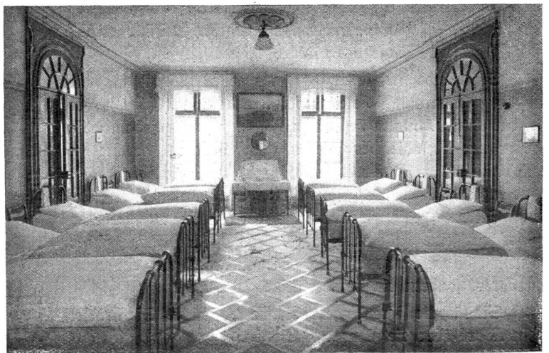
Herberge zur Heimat, Bern. Ein Schlafsaal.