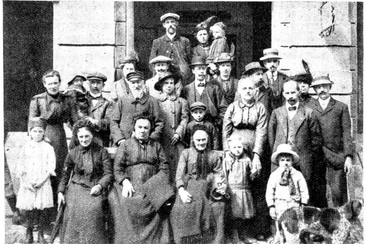
Herberge zur Heimat, Bern. Eine Gruppe belgischer Flüchtlinge.

Die Räume des ehemaligen Patrizierhauses erhielten mit dem Einzug der ersten Gäste vor 25 Jahren ein ungewohntes Leben. Der Handwerksgehilfe, der in fremde Lande auf die Walz geht, hat mit der Zeit einen andern Schicksalsgefährten erhalten: den Wanderer der Landstraße. Bei Kriegsausbruch aber ist die Herberge zur Heimat noch anderen Kategorien von Heimatlosen zur Zuflucht geworden: zuerst den Belgiern, die aus den besetzten Gebieten fliehen mußten, und dann in der Folge einer großen Zahl weiterer Kriegsopfer. Flüchtlinge, Evakuierte, Deserteure, Auslandschweizer in erheblicher Zahl, Emigranten aus Palästina, sogar Chinesen, die von den Russen nach der Schweiz verschickt wurden, in letzter Zeit Familien von Rußlandsschweizern — die Herberge zur Heimat gleich jahrelang einem kosmopolitischen Lager. Welche Aufgabe aus der Aufnahme dieser Leute, die aus den verschiedensten Lebensgewohnheiten heraus in ein fremdes Land mit Kind und Regel verschlagen wurden, den Hauseltern erwuchs, vermag bloß der Eingeweihte einzuschätzen.