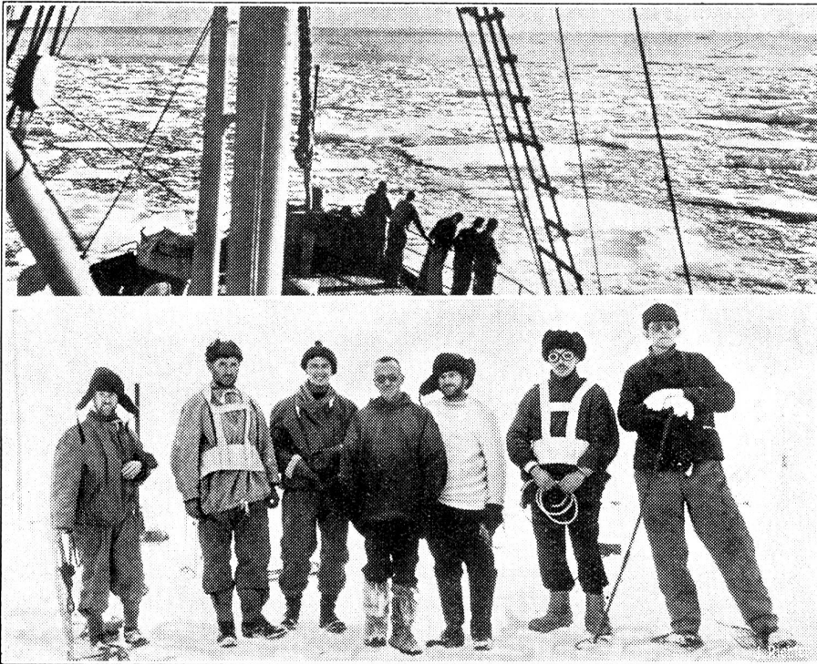
Eines der ersten Bilder von der wunderbaren Rettung Ellsworth.

Mitten im Polareis von „Klein-Amerika“ wurden der Südpolforscher Ellsworth und sein Begleiter, Pilot Hollick-Kenyon monatelang gesucht und endlich auf wunderbare Art und Weise von dem Expeditionsschiff „Discovery II“ entdeckt und gerettet. Unser Bild zeigt oben, die „Discovery II“ im Packeis auf der Rückreise, unten: Ellsworth (in der Mitte ohne Kopfbedeckung) mit Mitgliedern der Mannschaft der „Discovery II“.