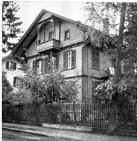
Hospiz der Heilsarmee, Bern Fellenbergstraße 5.

stalten wollte, und die dann einem Gefangenewart nach dem andern die schadhafte Knöpfe und Kleideraufhänger ausbesserte. Und in den Annalen der Heilsarmee ist die Tatsache verzeichnet, daß eine bernische Pionierin, Fräulein