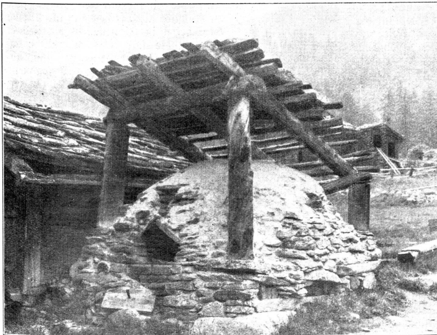
Backofen im Nikolaital.

Im Backhaus ist an der Wand eine Liste angeschlagen, auf welcher der Reihe nach alle Familien mit ihren bestimmten Back-