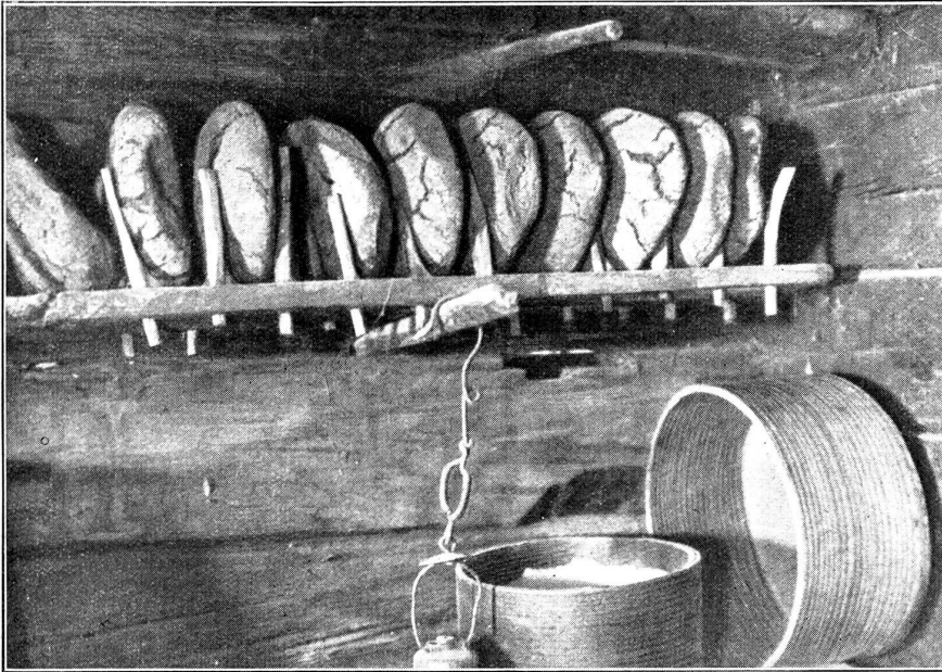
Aufbewahrung des Walliserbrotes im Speicher.