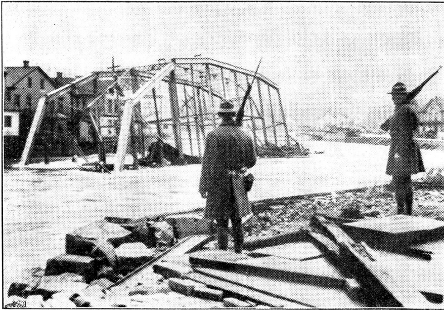
Eine Brücke von der Flut weggeschwemmt.

Unser Bild zeigt: eine Brücke, die von den Fluten von ihrem Fundament gerissen und vom Fluß Creek fortgeschwemmt wurde. Die Brücke befindet sich jetzt in der Stadt Johnstown im Staate Pennsylvania.