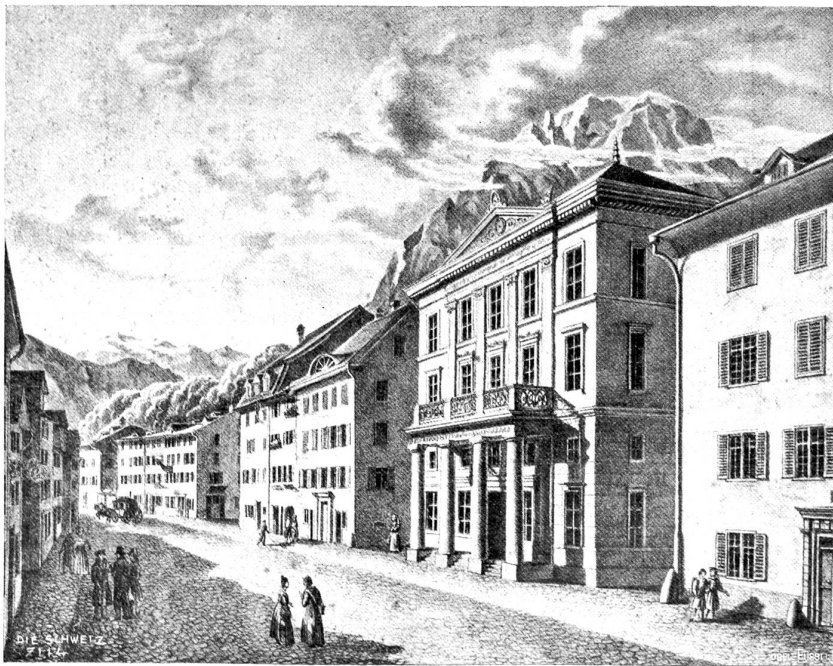
Regierunqsgebäude des Kantons Glarus vor dem Brande.