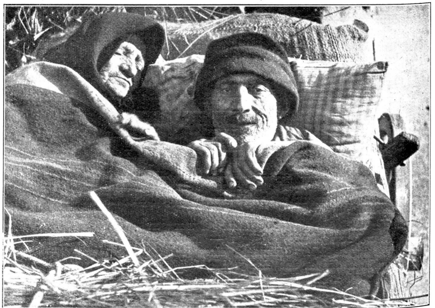
Alte Leute legen den langen Weg im Maultierwagen zurück, fein warm in Stroh und Decken verpackt.

Ich danke ihm für die freundliche Auskunft und ging bergan. Immer wieder mußte ich großen Viehherden, be-