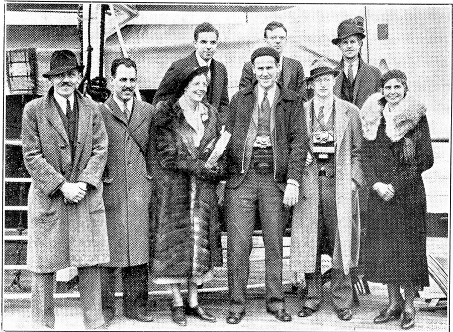
12,000 Kilometer unterwegs wegen einer totalen Sonnenfinsternis von 2 1/2 Minuten.

„Ja, sie soll uns bezahlen, was sie uns gestohlen hat.“ (Fortf. folgt.)