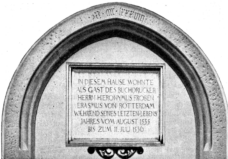
Gedenktafel am Hause Bäumleingasse 18 zur Erinnerung an den Aufenthalt des Erasmus von Rotterdam im „Haus zum Luft“ 1535—36.