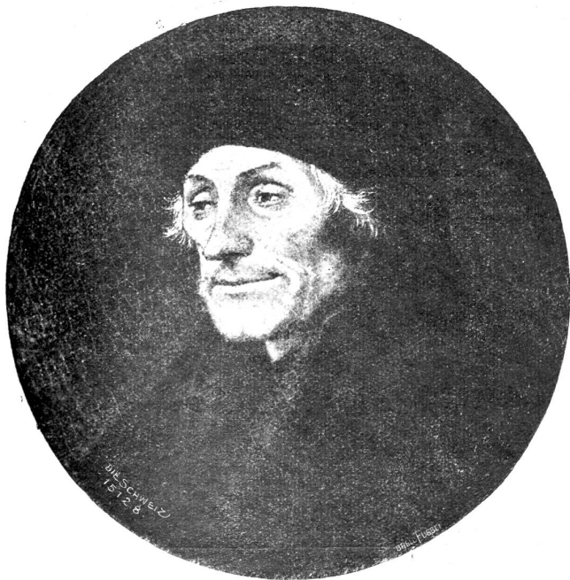
Erasmus von Rotterdam.

Schreiben. Die Sache des Evangeliums dürfe auch nur in dem friedlichen Geiste des Evangeliums vertreten werden.