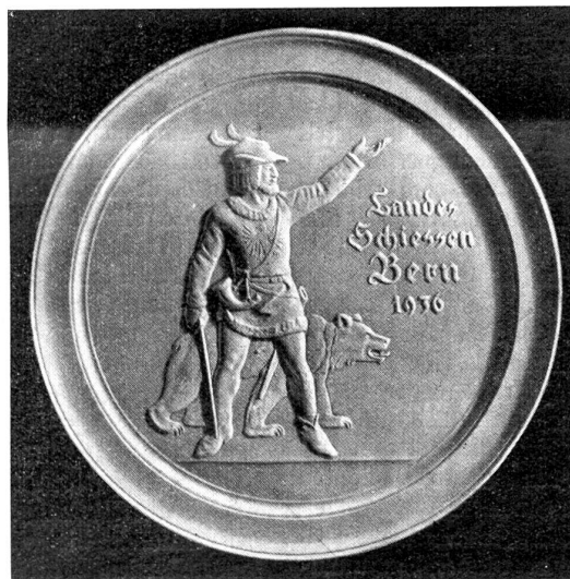
Zinnteller von K. Moser, Bern.