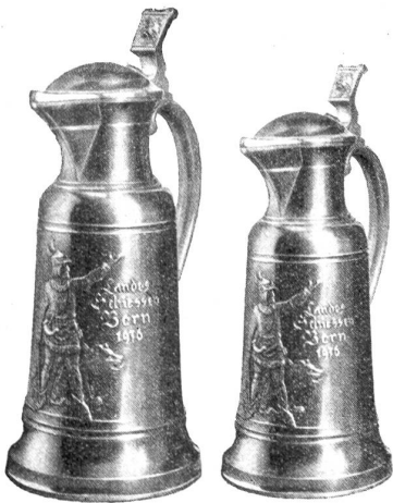
Zinnkannen von K. Moser, Bern.