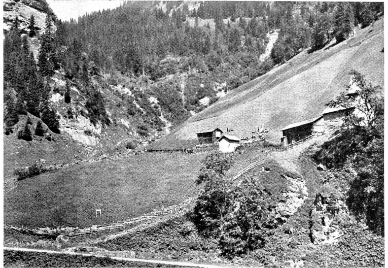
St. Martin in Calfeisen. 1350 m. St. Martinsfest, Sonntag nach Jacobi.

Die fünf Stunden lange Wanderung durch die Tamina-schlucht und das waldige Taminatal über Bättis nach Sanct