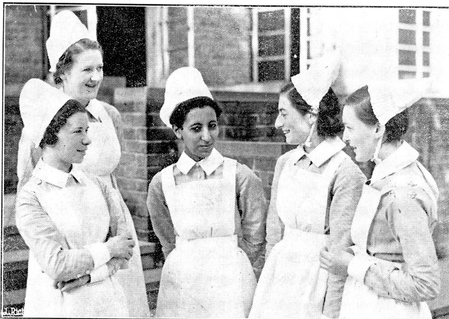
Die Tochter Hailé Selassie's als Krankenschwester.

Was hat denn die rote Regierung gegenwärtig für Probleme zu bewältigen, und warum greift sie auf die alten Revolutionäre, um Sündenböcke zu finden? Warum scheint ihr gerade ein Griff auf die ehemals führenden, neben Stalin einflussreichsten und bei Lebzeiten Lenins weit bedeutendern Bolschewisten am ungefährlichsten zu sein? Denn es ist klar, die Erschossenen und die Tausende von Verhafteten sind Sündenböcke. An die Verschwörung glauben in Europa und Amerika nur die ganz und gar der Phrase hörigen „reinlinigen“ Kommunisten, die gestern noch die Erschossenen zu den Heiligen ihrer Partei gezählt. Alle andern, die denken können, überlegen sich, daß Stalin mit irgendwelchen Widerständen zu ringen hat, von denen die Außenwelt nichts weiß, und daß er in eine unsichtbare Front von Gegnern vorgestoßen und ein paar Köpfe herausgegriffen, und zwar diejenigen, die mit ihrem Fall dem Regime am meisten dienen und am wenigsten schaden. Unter allen Vermutungen, die in den Zeitungen des Westens erhoben werden, kehrt die eine am häufigsten wieder: Die Generalität der Roten Armee ist im Spiel. Nur weiß niemand recht, inwiefern und mit welchen Zielen. Der Kommandeur des Fernen Ostens, Blücher, wird genannt und auch wohl mit Bonaparte verglichen, der einst der französischen Revolution den Garaus machte. Die hohen Offiziere, so viel kann man sich denken,