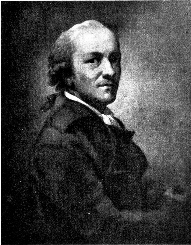
Anton Graff: Selbstbildnis des Künstlers im Alter von 61 Jahren. (Kunstsammlung Winterthur.)

von der neuen Maschine, die der Vater vorsorglich während des Festes aufgestellt hatte, damit, wenn der Werktag anbräche, alles zum Geldverdienen bereit wäre. Adeli brach auf einem Stuhl zusammen und starrte auf die beiden Martergeräte, die hier und dort gespenstig, leicht vom Mondlicht gestreift, an den Wänden standen. Sie erschienen ihr, je länger sie hinschaute, immer unheilvoller, wie zwei besessene, lauernde, boshafte Wesen, zwei Teufel, die ihre Spinnenfinger nach ihr ausstreckten, von links und von rechts, um sie für immer festzuhalten und zu zerkrümmen. In ihrer Aufregung gab sie der Furcht immer mehr Macht über sich, kaum wagte sie sich auf ihrem Stuhl zu rühren. Die beiden Ungeheuer aber begannen zu wachsen, regten sich und krochen näher heran, ihre Finger wurden immer länger und spitzer, ihre Leiber immer gespenstiger und gedehnter. Die Spulen glöhten im Mondlicht wie zwanzig Augen. Da sprang Adeli auf und zurück ins Freie, es lief ihr kalt den Rücken hinauf, ihre Haare sträubten sich, sie fühlte ein jedes wie eine eisige Nadelspitze.