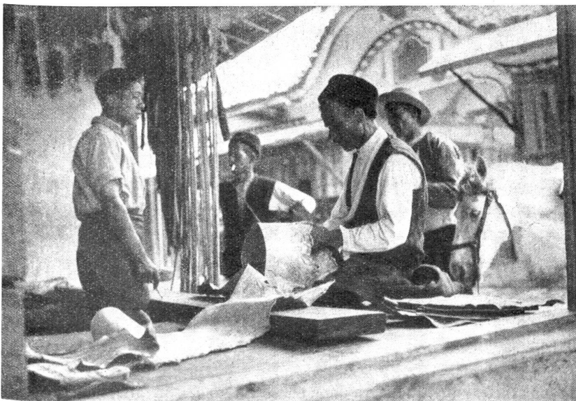
Herstellung der bäuerlichen Fußbekleidung (Opanken).

Wie aber wäre es, wenn ich mich der Wahrheitstreue beflisse? Ich spreche wahr und ehrlich zum Nächsten. Er aber mißbraucht dies und zwar vielfach. Dessen ungeachtet bleibe ich wahr und er weiß genau, woran er mit mir ist, denn das muß er ja fühlen. Er