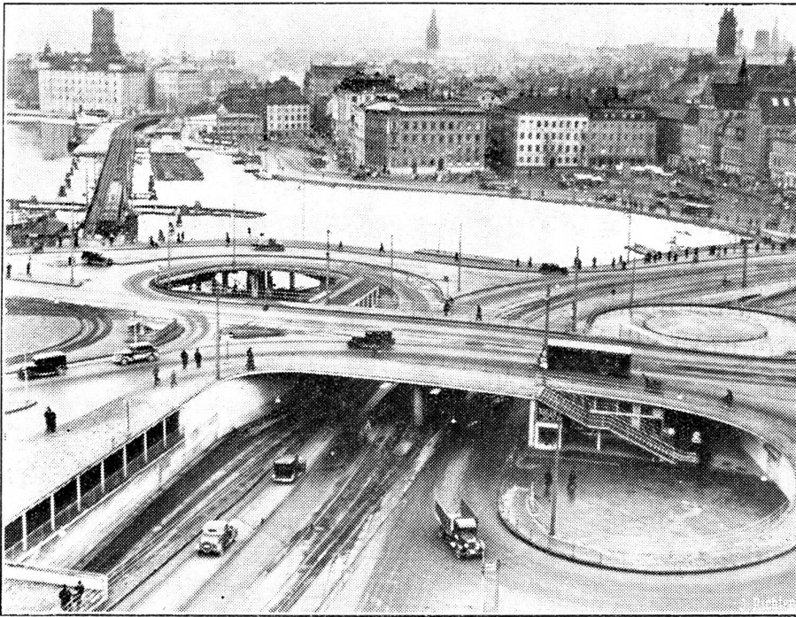
4 Etagenverkehr in Stockholm: Kanal, Untergrundbahn, zweistöckige Straße.

Kürzlich wurde in der schwedischen Hauptstadt ein Bauwerk fertiggestellt, das einen Verkehr in vier Etagen ermöglicht. Unser Bild zeigt im Vordergrund die Doppelstrasse, hinten den Mälärfluß und im Hintergrund links die Untergrundbahnlinie.