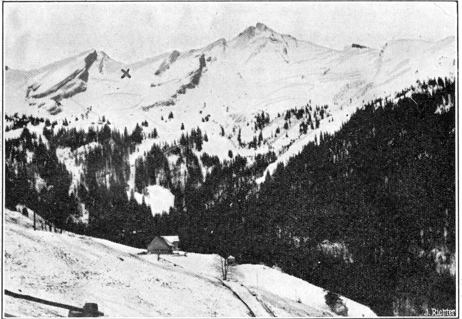
Zum grossen Bergunglück am Brisen. 7 Skifahrer in einer Lawine umgekommen. Wir zeigen hier eine neuste Ansicht des Brisen-Massives, wo sich das schreckliche Lawinenunglück ereignete. Die Stelle, wo die Skifahrer verschüttet wurden, ist mit (X) bezeichnet.

Die Mitglieder des Verwaltungsrates der Schweizerischen Unfallversicherungsanstalt in Luzern wurden alle wieder bestätigt, nur an Stelle des gewesenen Sekretär-Kassiers Brunner vom schweizerischen Uhrenarbeiterverband wurde neu als Vertreter der Obligatorisch-Versicherten