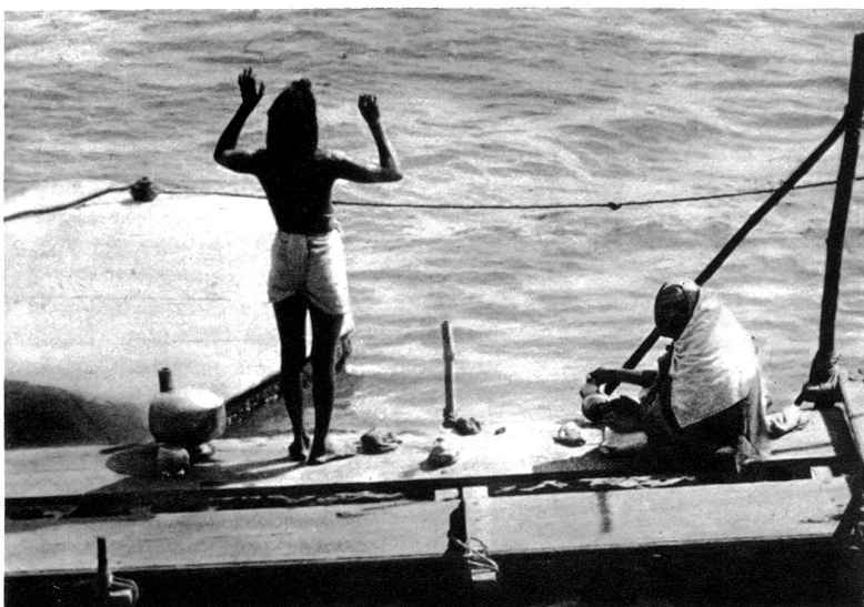
Gläubige Inder beten am Ganges

Mann mit sonnenbranntem Gesichte — der echte Sohn der Berge.