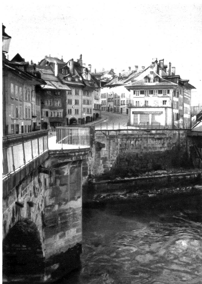
Nydegghbrücke mit Läuferplatz und Stalden

lager. Noch ist eine Kaufhausordnung aus dem Jahre 1373 bekannt. Die Häuser, die sich dem ehemaligen Kaufhaus anschließen, zeigen noch die Bauart des frühesten Mittelalters: enge Hauseingänge, schmale Treppen, damit das Haus besser verteidigt werden kann, sowie die großen Stuben mit den breiten Fenstern im obersten Stockwerk; hier pflegten die Frauen zu spinnen und zu weben. In dieser Häuserreihe befindet sich die zeitlich erste Wirtschaft der Stadt Bern.