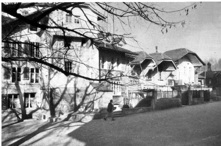
Häuserreihe des Nydegghöflis, die auf Mauern der alten Burg errichtet sind.

Die Seite des Nydegghöflis, die sich dem Stalden entlang zieht, hat gleichfalls Eingänge, die durch das ganze Haus hindurch gehen und am Stalden ausmünden. Zum Interessantesten gehört das Bäckerhaus mit seinem fröhlichen Erker, das