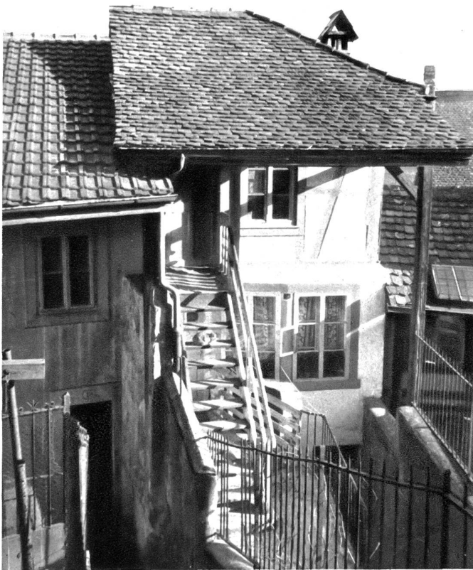
Treppe zum Zimmer der Zähringerfräulein