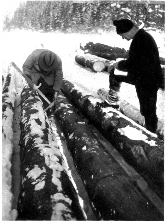
Zahlreiche Kubikmeter Laden sind auf den Sägereien aufgestapelt. Mit der Messkupe wird der Durchmesser eines einzelnen Stammes ermittelt. Es gibt Bauern, die über 100 Stämme in die Sägereien liefern