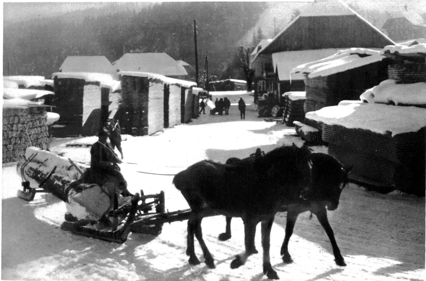
Der Transport der grossen Baumstämme von den Wäldern zu den Sägereien dauert vom November bis Februar