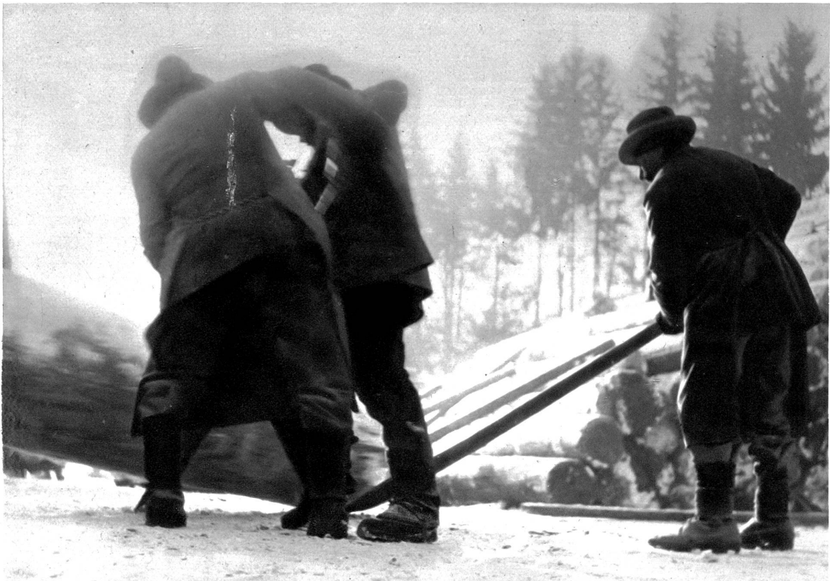
Holzarbeiter beim Verladen der Stämme