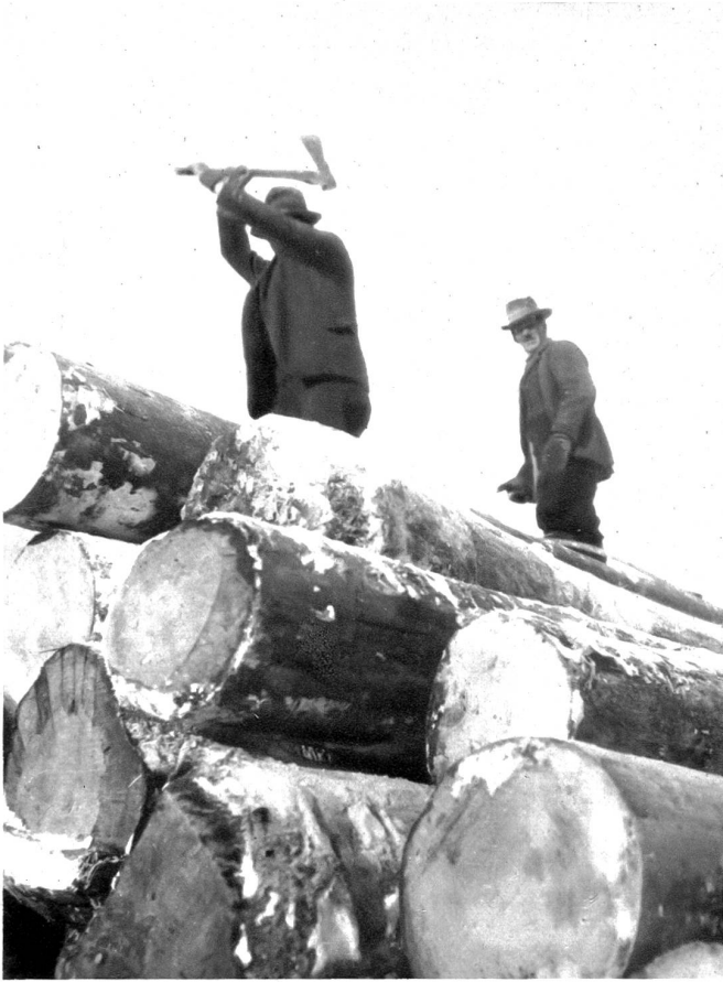
Das Aufsichten der schweren Trämel erfolgt maschinell. Oben auf dem Holzberg steht ein Mann, der dem Maschinisten bei den Motoren das Zeichen gibt, wenn der schwere Stamm oben in die richtige Lage gelangt ist