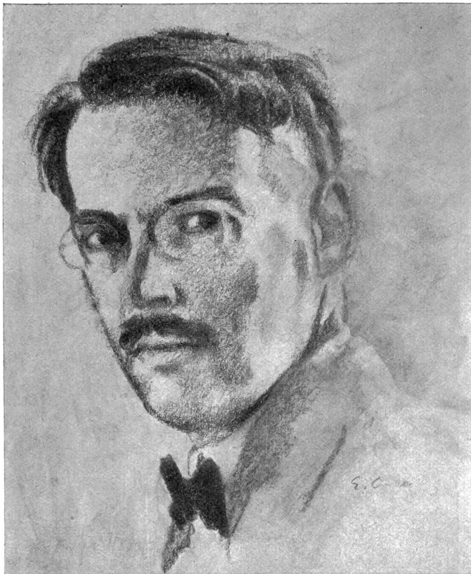
Emil Cardinaux — Selbstbildnis