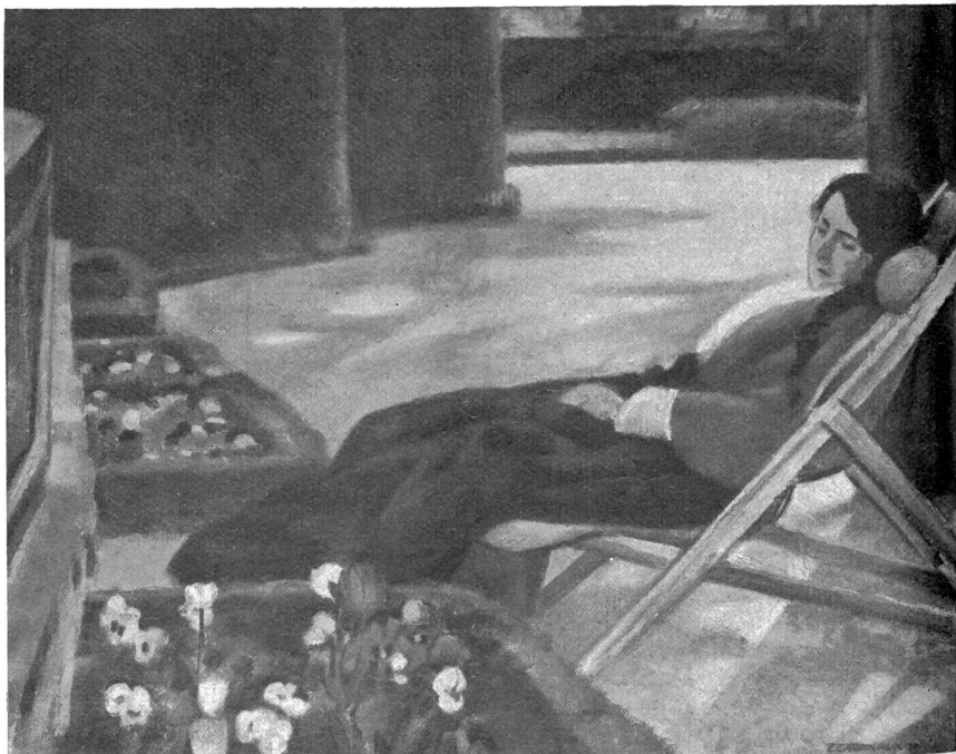
Emil Cardinaux — Genesende