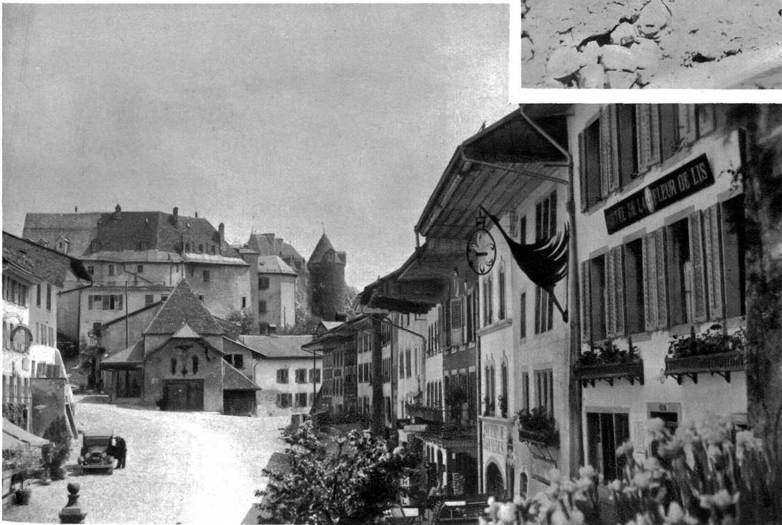
Strasse in Greierz