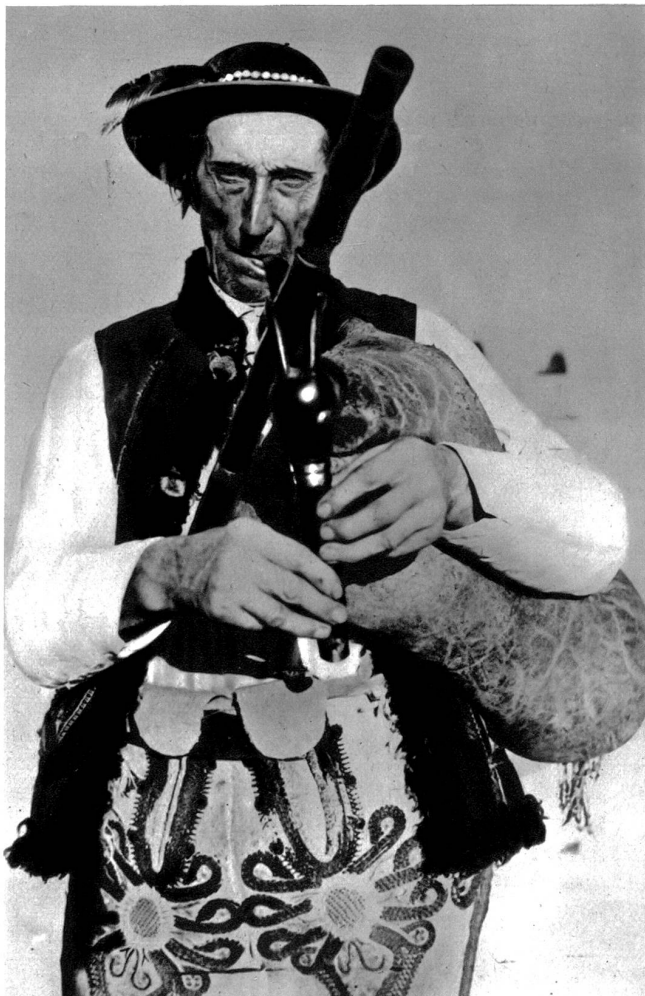
Ein alter Dudelsackpfeifer, ein Gorale (Bergbewohner in der Tatra) aus der Gegend von Zakopane