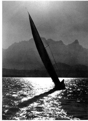
Segelmondscheinfahrt auf dem Thunersee