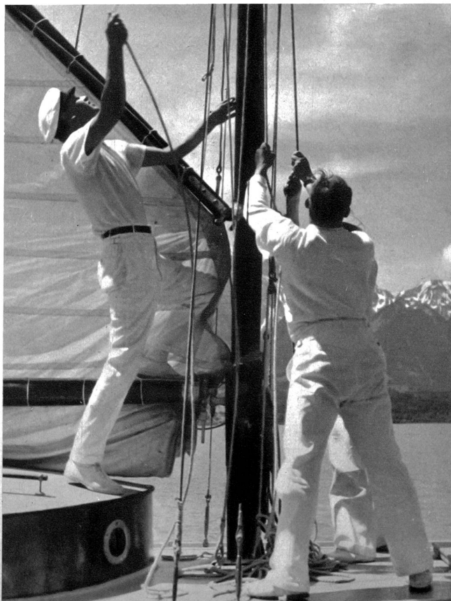
Hochziehen der Segel

Der Hauptunterricht wird, — wie bisher — vom Standort der Segelschule (Hilterfingen) aus erfolgen, dagegen findet regelmäßiger praktischer und theoretischer Unterricht auch in und ab Spiez und — soweit Bedarf — in und ab den übrigen Uferorten des Thunersees, statt. Das Bootsmaterial wird dieses Jahr ausreichen, um — auch in der Hochsaison — an Mitglieder anderer Yachtclubs oder weitere segelkundige Kurgäste des Thunersee-