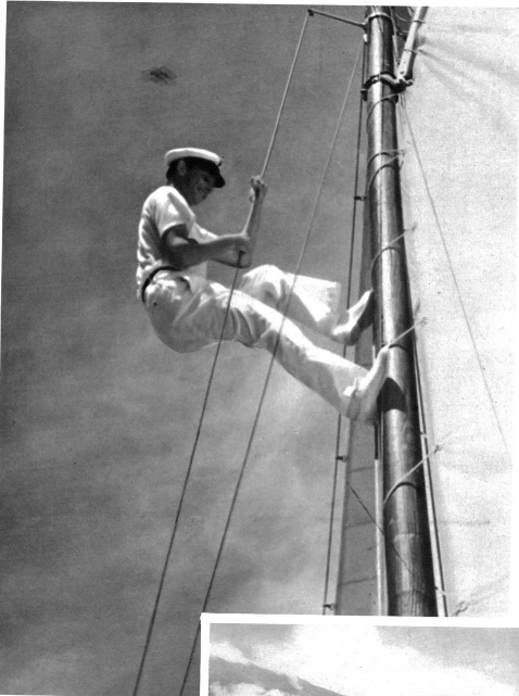
Inspektion am Grossmast