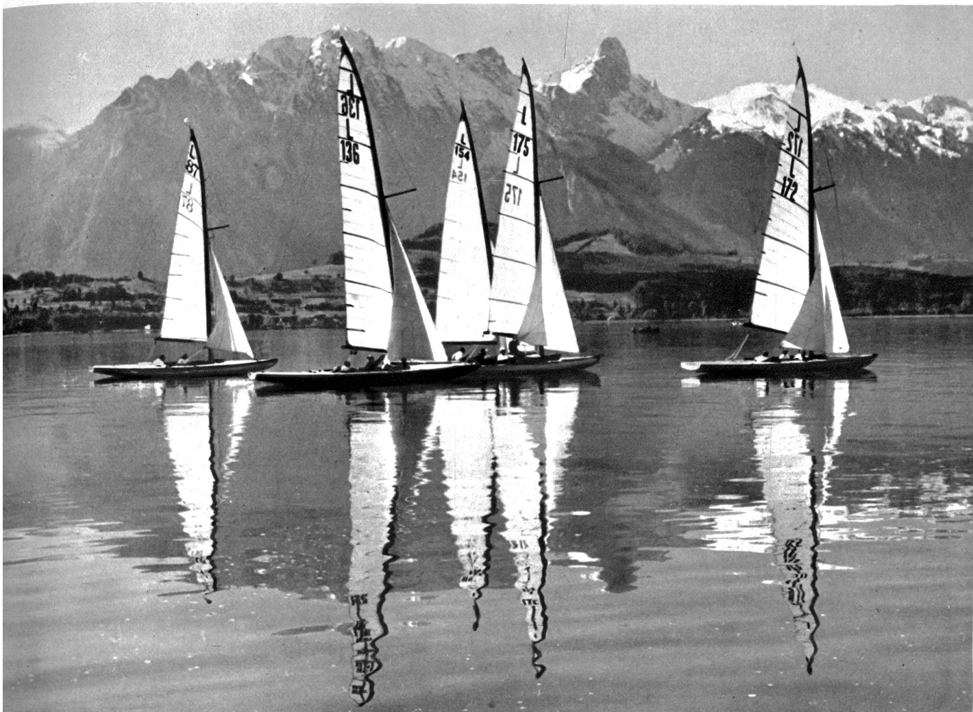
Segler mit Stockhornkette im Hintergrund