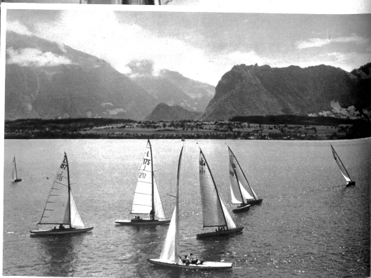
Segelregatta auf dem Thunersee. Spannender Kampf der 30m 2 Yachten