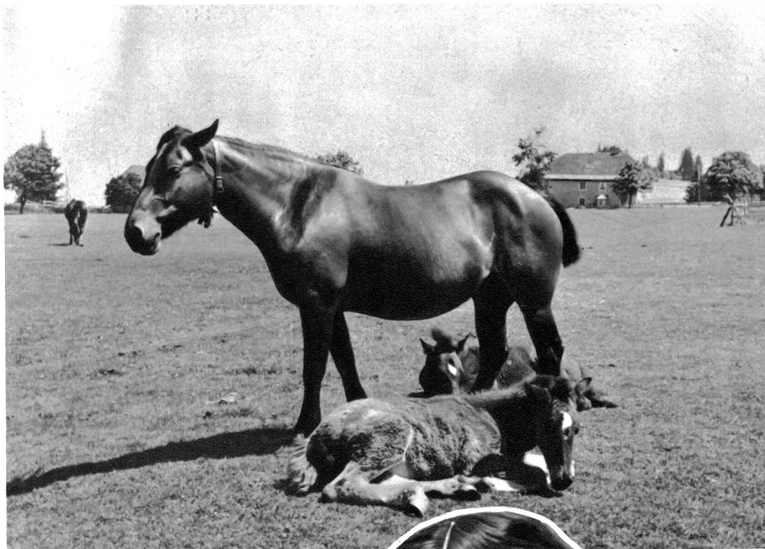
In den Freibergen. Saignelégier

wogende Aehrenfelder fehlen fast ganz. In den Jurawäldern wohnt andächtige Stille. In ihrem Dürster lebt das Märchen und das Geheimnis. Die Tannennadeln und die Moose weben weiche Teppiche zwischen die Stämme, und die Farne wuchern wirr umher, und manche seltsame Blume gedeiht in ihrer Einsamkeit. Die blauen und gelben Helme des Eisenhuts findet man da und die schöne Türkenbundlilie, der schöne Frauenschuh, diese beinahe ausgestorbene Orchidee.