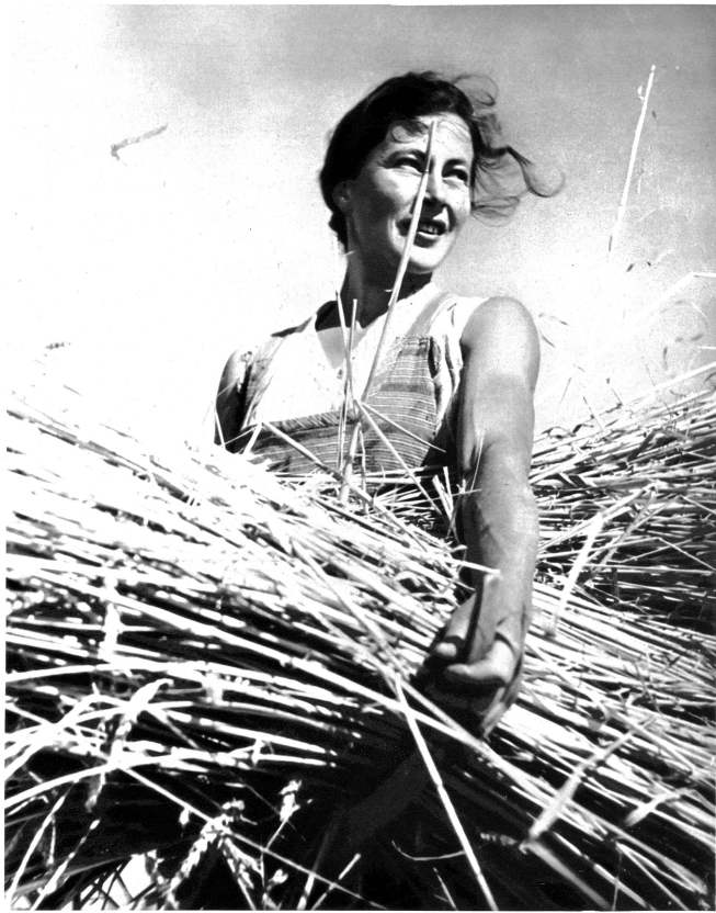
Die Garbe wird zusammengebunden