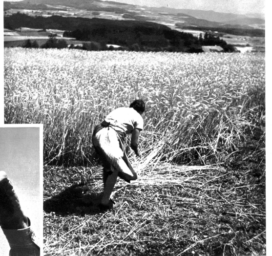
Wiederum rauschen auf dem Lande draussen die reifen Aehrenfelder