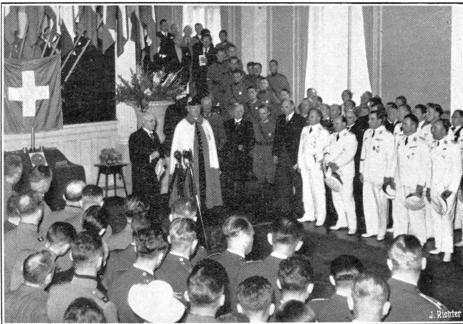
Das internationale Flugmeeting in Zürich.

Das Eidgenössische Volkswirtschaftsdepartement teilt mit, daß die Anpassung der Inlandverkaufspreise für Benzin infolge der steigenden Weltmarktpreise unvermeidlich war. Der Detailverkaufspreis wird deshalb ab Säule von 43 auf 45 Rappen pro Liter erhöht, und auch die übrigen Ansätze wer-