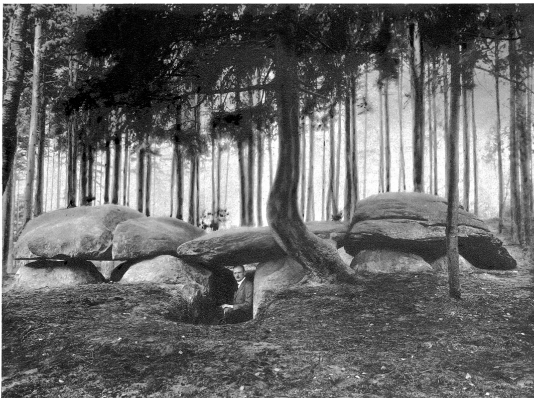
1924 von Professor Dr. K. M. Jacob-Friesen ausgegrabene Steinkammer, die sich bei Fallingbostal befindet

Dieses Steingrab bei Fallingbostal besteht aus einer grossen Kammer, die 6,5 m lang und 2 m breit ist. In der Mitte der Abbildung, zwischen den kleinen Steinen lässt sich eine Lücke, der alte Eingang der Grabes, erkennen