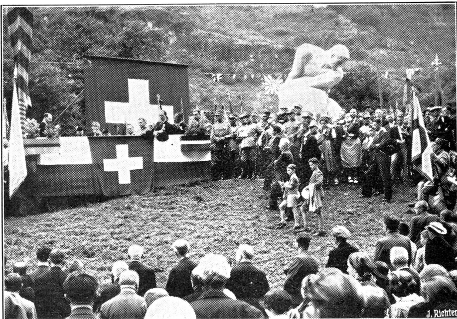
Einweihung des Schlachtdenkmals von Giornico.

Genf beging die Feier mit einem großen Umzug, an dem sich die vaterländischen