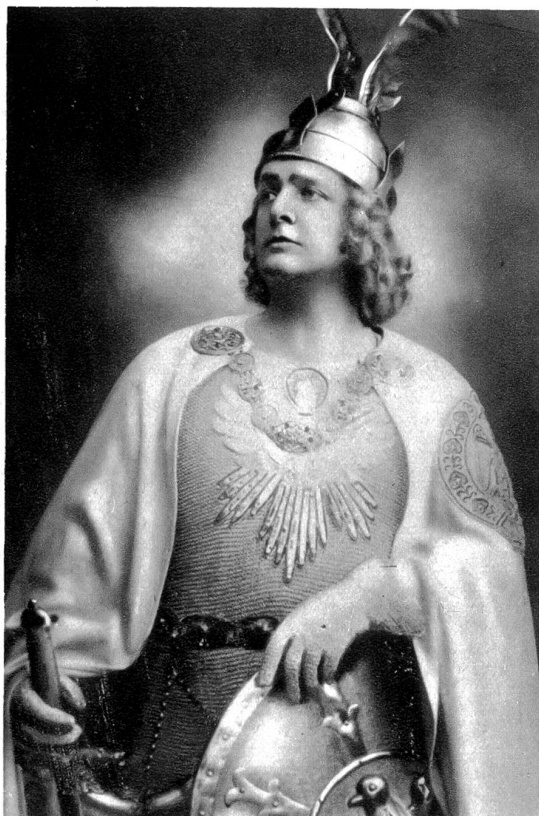
Kammersänger MAX HIRZEL als Gast. (Bild links)