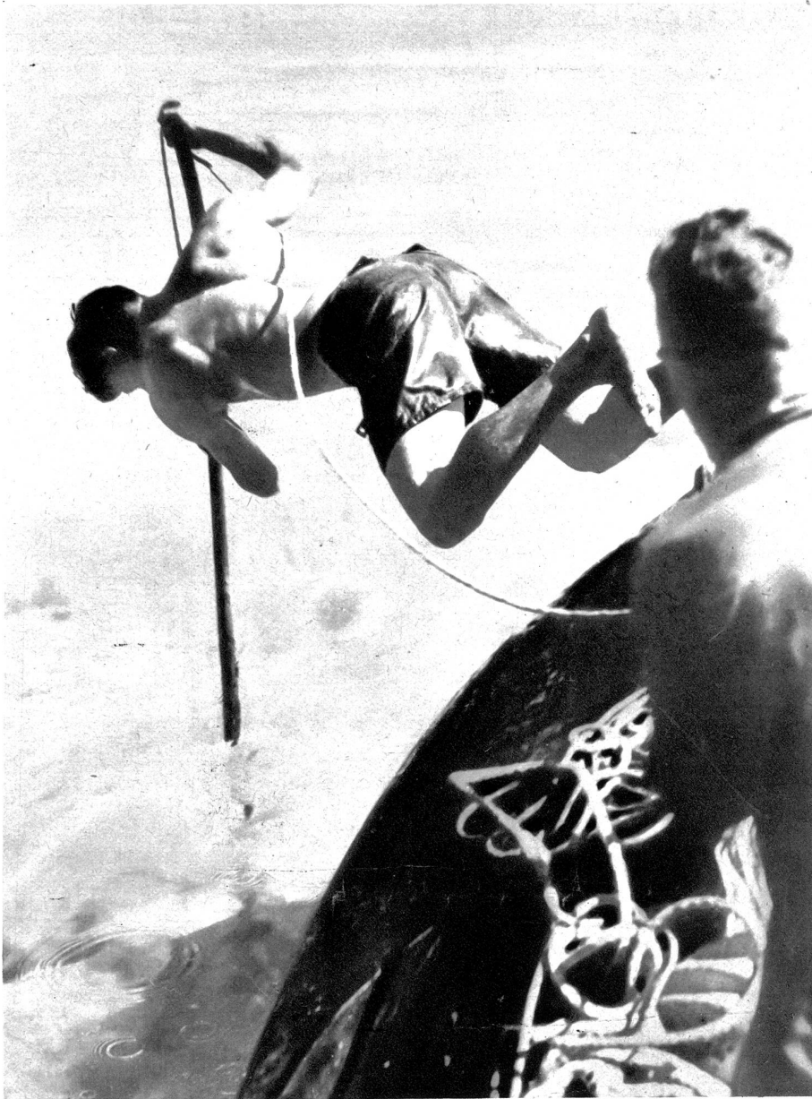
Turtlespearing heisst dieser aufregende Sport und bedeutet das Erlegen von Schildkröten unter Wasser