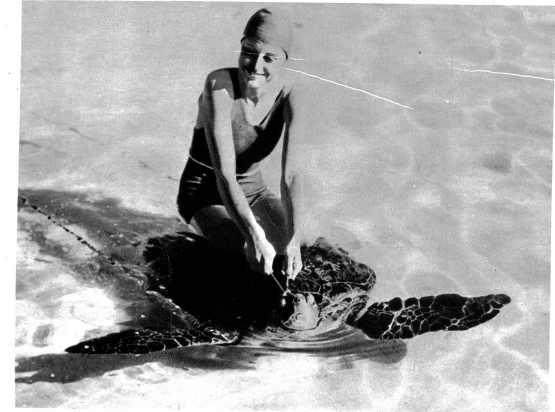
Das Reiten auf zahmen Schildkröten (gezähnten) ist ein Sport, der Geschick und Gleichgewichtssinn erfordert