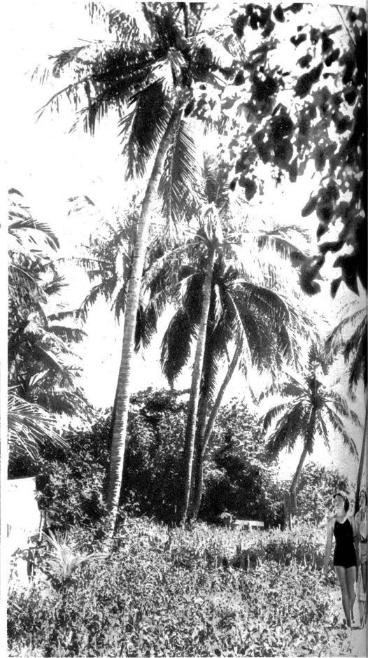
Spaziergang auf der grünen Tropeninsel