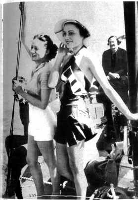
Auf dem Fischkutter der Küste entlang