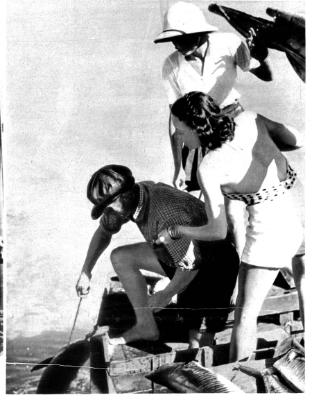
Makrelenfischfang vom Boot aus. Diese Fische sind bis zu 50 Pfund schwer