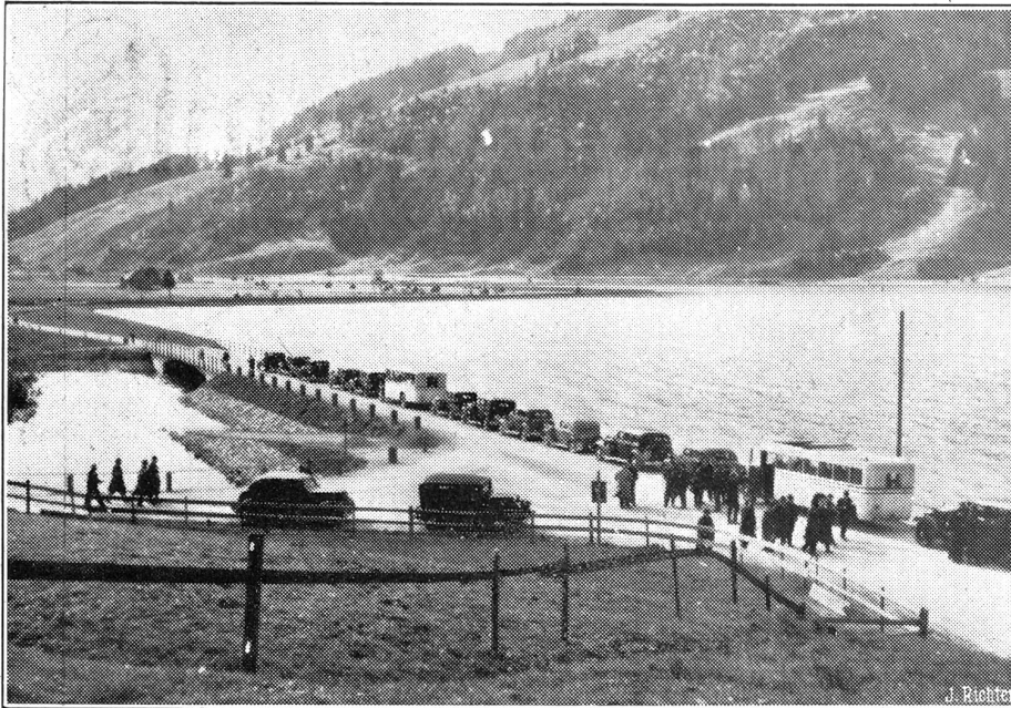
Eröffnungsfeier des Etzelwerkes.

Am Samstag nachmittag fand in Anwesenheit von Vertretern der Nordostschweizerischen Kraftwerke, der S. B. B., Behörden, Presse usw. die offizielle Eröffnungsfeier der Etzelwerkbauten statt. Die Wagenkolonne mit den Teilnehmern an der Eröffnungsfeier beim sog. Höhport, wo die Sihl sich in den Sihlsee ergiesst.