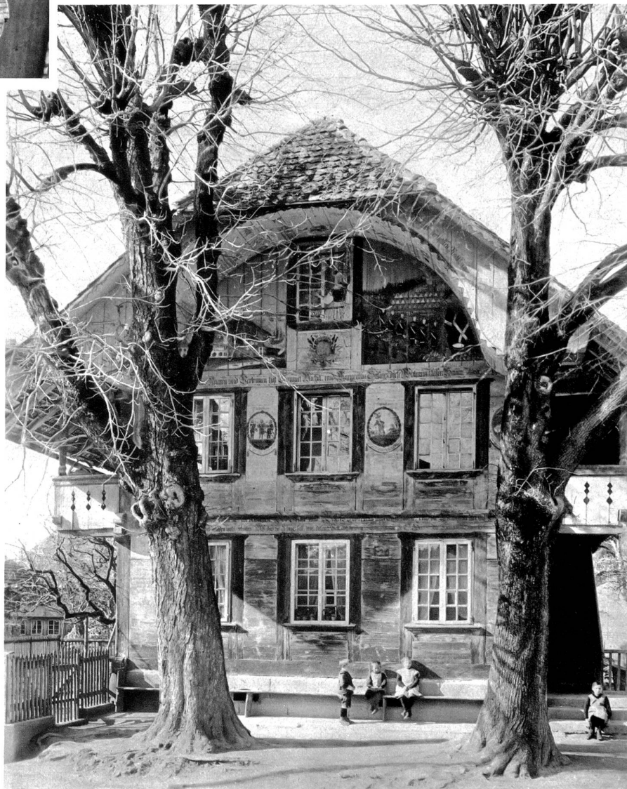
„Stöckli“ in Niederscherli

Der bernische Heimatschutz hofft in genannter Weise nach und nach die meisten der über 100, auf das ergangene Rundschreiben an die bernischen Gemeinden angegebenen Häuser, die der Renovation in Malereien und Architektur bedürftig sind, wieder in ansehnlichem Gewande erstehen zu sehen. Weil dabei jeweilen nach Tunlichkeit die Maler und Zimmerleute der betreffenden Gegenden herangezogen werden, so erwartet er dazu ein allseitiges Entgegenkommen von Seiten der Hausbesizer und Gemeinden.