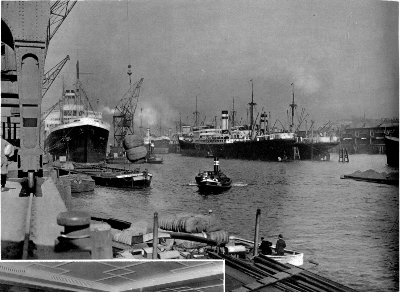
Im Hafen der Hamburg-Amerika-Linie