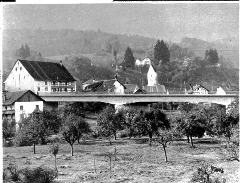
Die Landschaft baut Verkehrsbrücken. Eine vorbildliche Verkehrsbrücke über die Töss ist in Rorbis-Freienstein ihrer Zweckbestimmung übergeben worden. Die Brücke mit ihrer breiten Fahrbahn, genügt modernsten Verkehrsanforderungen.