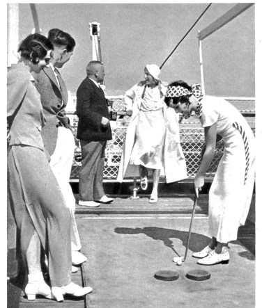
Auf dem Sportdeck des Dampfers „New York“.

Und arbeitam. Die Bororte Hamburgs beherbergen eine ungeheure Zahl von harten Männern, welche all und jeden Morgen um sechs