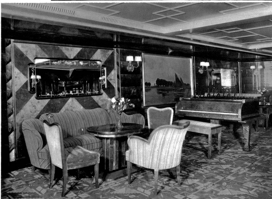
Dampfer „New York“. Damenzimmer 2. Klasse