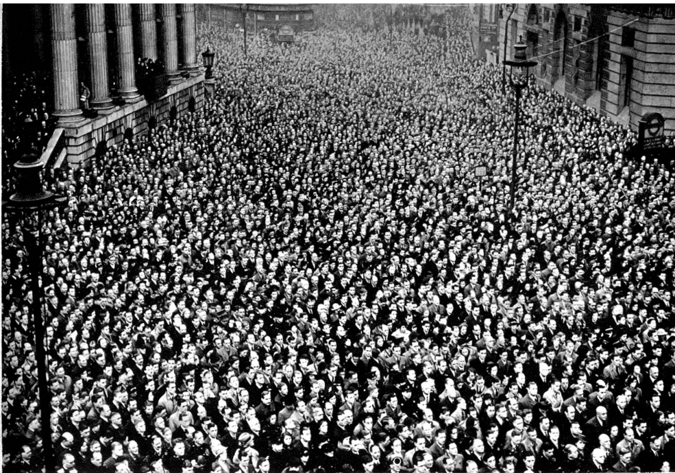
London. Zum Gedenken an die im Weltkrieg gefallenen Engländer fand vor kurzem im ganzen britischen Weltreich die übliche 2 Minutenstille statt. Die 2 Minutenstille vor der Royal Exchange im Herzen der City von London.