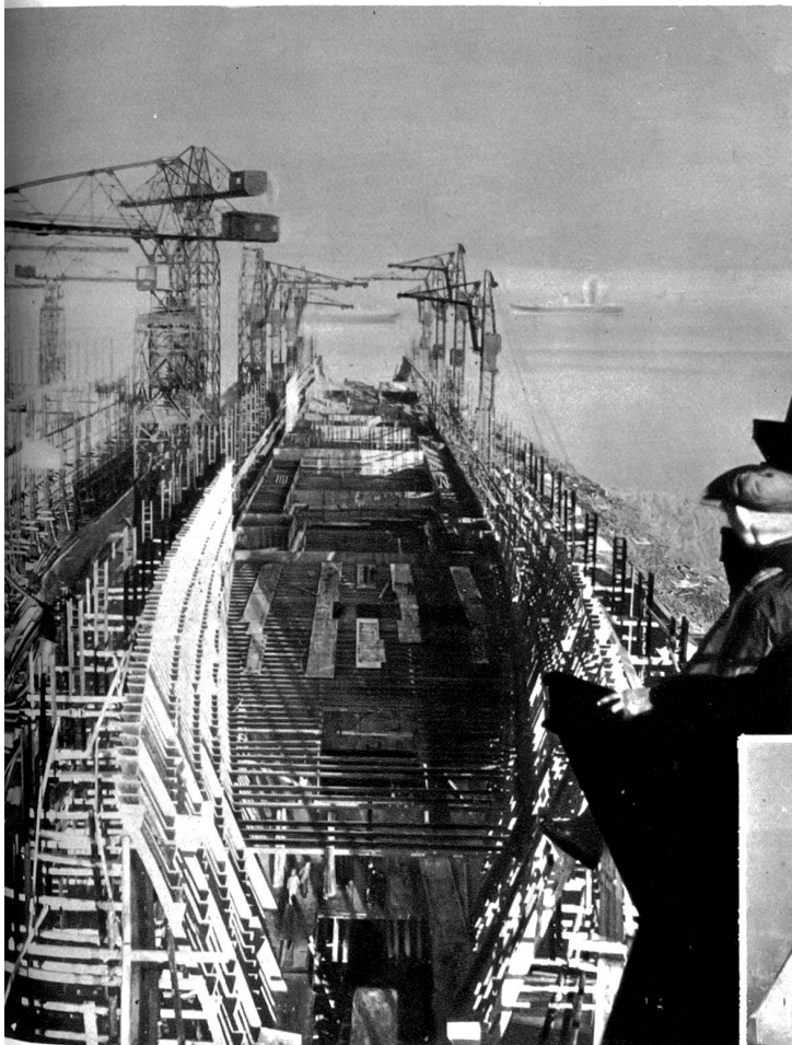
Die neue „Mauretania“ im Bau. Für die Cunard White Star Linie wird zur Zeit auf Cammel Laird Werft in Birkenhead bei Liverpool ein dreitausend Tonnen Schiff gebaut, das der Nachfolger der berühmten „Mauretania“ werden wird. — Das Schiff wird voraussichtlich im Jahre 1939 in Dienst gestellt werden.