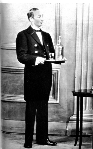
Der Typ des vollkommenen englischen Dieners