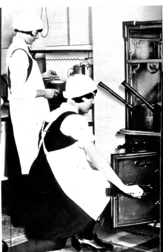
Die Küchenmädchen haben gewöhnlich nichts mit dem übrigen Hause zu tun und werden von der Köchin selbst engagiert