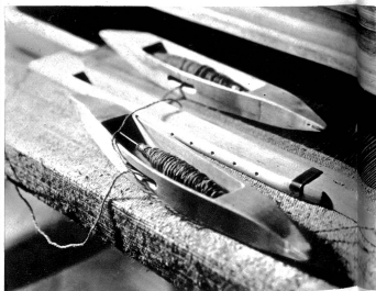
Die „führigen“ Geister des Webstuhles, die Schiffchen

Arbeiten zuzuge gebracht. Längst wird das „Stiefel“, wie der Webstuhl in unsern Bergen heißt, nicht mehr für den Selbstgebrauch allein gebraucht, nein, man trachtet darnach, durch die geübte und solide Hand- und Kunstarbeit die maschinellen Teppiche und Vorhänge zu verdrängen. Und wer einmal die feinen, künstlerisch hochwertigen Muster betrachtet hat, der wird daran seine helle Freude finden. Hier ist's ein schmuder Vorleger, da der Leberzug zu einem Kissen, hier ein originelles Tischstud, das uns entzückt, in jenem