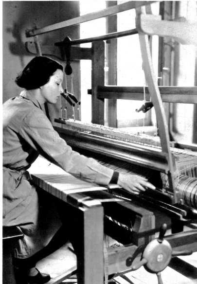
Studie am Webstuhl

Und was haben unsere Handwebereinen, denn zur Hauptfache pflegen doch die Frauen dieses Kunstgewerbe, nicht für berufliche