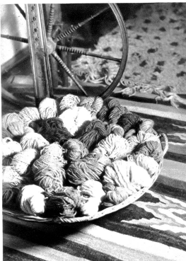
Wolle — Ausgangsstoff für die schmucken Webarbeiten

Zimmer sind's die Vorhänge und sieb' nur an: selbst die dicken Kleider der Hausfrau sind aus handgewebten Stoffen hergestellt.