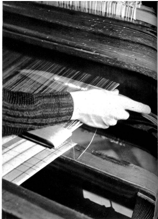
Ric-rac — fährt das Schiffchen husch—husch durch die Fäden

Arbeiten zuzuge gebracht. Längst wird das „Stiefel“, wie der Webstuhl in unsern Bergen heißt, nicht mehr für den Selbstgebrauch allein gebraucht, nein, man trachtet darnach, durch die geübte und solide Hand- und Kunstarbeit die maschinellen Teppiche und Vorhänge zu verdrängen. Und wer einmal die feinen, künstlerisch hochwertigen Muster betrachtet hat, der wird daran seine helle Freude finden. Hier ist's ein schmuder Vorleger, da der Leberzug zu einem Kissen, hier ein originelles Tischstud, das uns entzückt, in jenem