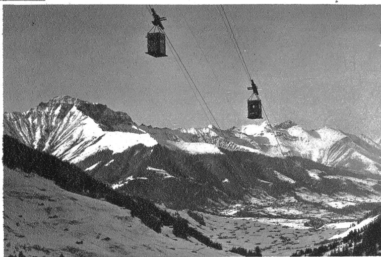
Schwebbahn Engstligenalp (Adelboden)