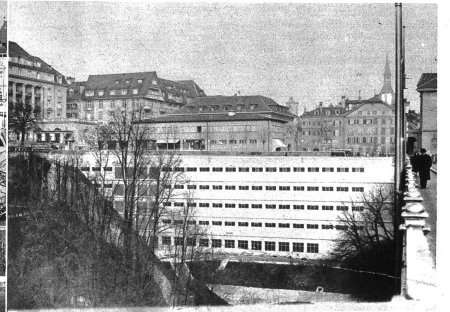
Und nun sieht die Sache von der Kirchenfeldbrücke aus gesehen so aus. Die Fassade der neuen Grossgarage