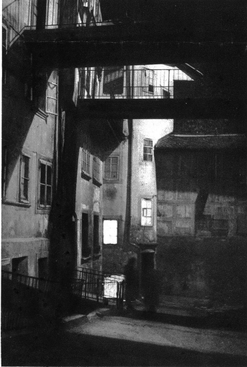
Es war einmal . . . nächtliches Motiv aus dem alten Gerbergraben