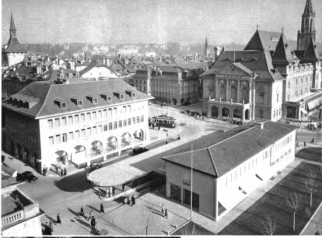
Aus der Vogelperspektive

„Was lange währt, kommt endlich gut“, sagt ein bekanntes Sprichwort. Nun, die Geburtsjahre des nunmehr um- und neugebauten Kasinoplatzes sind auf 14 angefallen, wenn man das Jahr 1924 berücksichtigt, in welchem der erste Wettbewerb zur Neugestaltung dieses schwierigen Verkehrsplatzes stattgefunden hat. Inzwischen ist viel Wasser durch die Gasse geflossen und manches Wort ist zum Thema Kasinoplatz gefallen. Die Bilder zeigen Altbekanntes wie es war und Neues wie es nun entstanden ist. Der Bürger mit gesundem, kritischem Sinn mag selbst urteilen und abmessen, was er bei dieser großen baulichen Veränderung im Herzen der Stadt gewonnen und wohl auch verloren hat. Es ist hier nicht am Platze, das Regulative besonders hervorzuheben, freuen wir uns einiger Vorteile und neuer Schönheiten, die die Stadt mit großem Geldeaufwand gewonnen hat. Vor genau 2 Jahren (am 28. Dezember 1935) ist in der Berner Woche ausführlich über die alte Hauptwache berichtet worden, die als Teil mit in das Gesamtprogramm des Kasinoplatzes einbezogen werden mußte. Nun steht sie also an ihrem alten Platz in veränderter Situation und hat vorerhand Zeit, sich ihre neue Umgebung in Ruhe zu betrachten. Die Bauten Hotelgasse 12 und 14 werden demnächst abgebrochen; an ihrer Stelle wird ein Neubau erstellt werden, um den Engpaß bei der alten Hauptwache dadurch zu beseitigen. et.