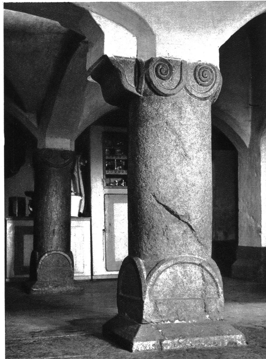
Unten: Die Küche mit zwei massiven Kalksäulen