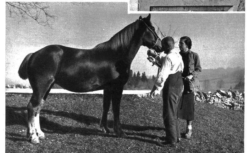
Unten: Die Stute „Fanny“ wird den Besuchern vorgeführt