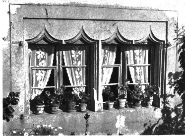
Oberes Bild: Das Mittelfeld der eingeleigten Kassettendecke Mitte: Das grosse Stubenfenster mit gotischen Flammen Unten: Die Küche mit zwei massiven Kalksäulen