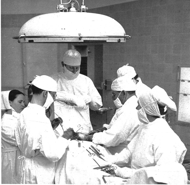
Professor Dr. F. de Quervain (rechts), umgeben von Assistenten und Schwestern bei einer Kropfoperation. Der reifliche Chirurg arbeitet heute noch in ungeschwächter Rüstigkeit.

propylaktische Behandlung des Strofes, der traditionsgemäß ein wichtiges Arbeitsfeld der Berner Klinik bildet, wie auch auf vielen andern Gebieten chirurgischer und wissenschaftlicher Tätigkeit. Seine scharf formulierten Arbeiten über Diagnostik und Behandlung chirurgischer Erkrankungen, wie auch sein hervorragendes Behalten und sein großes, operatives Können, ha-