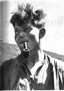
Senne aus dem Haslital