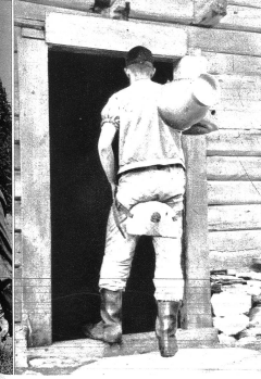
Jetzt muss er no ga mäliche

Eine der ersten Arbeiten auf der Alp ist das Zaunen, damit die weidenden Tiere sich nicht verlaufen oder gar in den Abgrund stürzen können. Nachdem der Käsestoff im Kessel seine nötige Wärme erreicht hat, wird die Masse mit dem Kästuch herausgenommen.