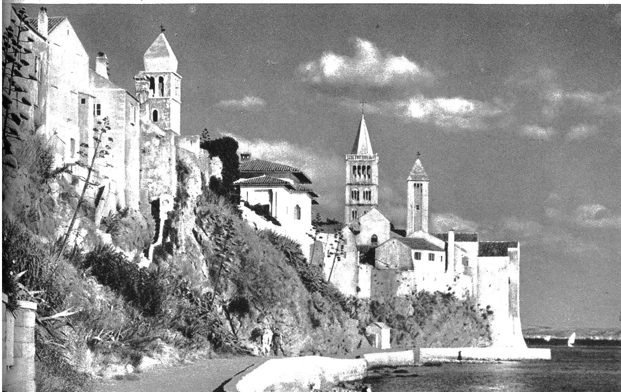
In der Bucht von Rab

Frühling, Sommer und Herbst in Jugoslawien — sehnsüchtige Erinnerungen voll Duft und Farbe sind es, Robinsonaden holden Nichtstuns auf grünen Inselchen, wo die saftige Rebe wächst und nachts der Schafal den Mond anbellt. Traum einer Wirklichkeit, die sich immer wieder neu entdecken läßt, im Zauber der ewigen Natur wie im Reichthum einer kulturstolzen, mannhaften, vielgewandelten Geschichte.