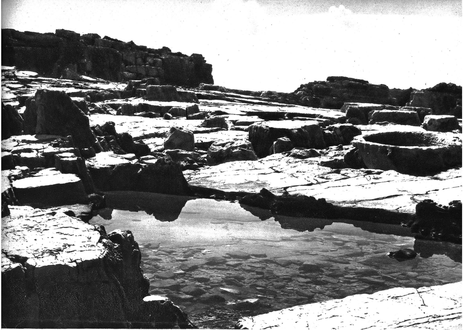
Terrasse bei Lokrumen ob Dubrownik