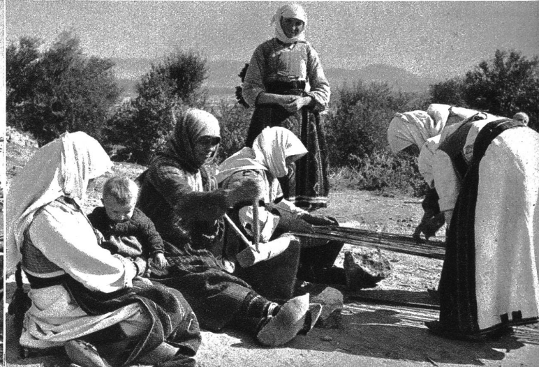
Web-Idyll aus Staro

ihren bunten Bildern bestaunen können, an den Kunstgemälden die erhebende und erschütternde Geschichte des Volkes ablesen, von der Zeit der Griechen und Römer her über die Völkerwanderung der germanischen und asiatischen, dann slavischen Stämme bis zum Einfall der Osmanen, dem Glanz und Verfall Venedigs, der all diesen Küstenstädten am stärksten sein Gepräge aufgedrückt hat, und weiter die Jahrhunderte der neueren Zeit hin.