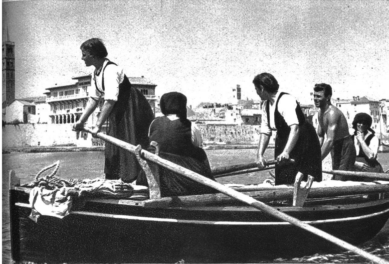
Auf der Fahrt hinaus in die Bucht von Euphenia

Den vollen Genuß einer Adria- oder Jugoslawenreise hat aber erst der, der sich von Ort zu Ort Zeit lassen und die Küste und das Innere des Landes ohne raschen Reisezwang geruhsam besuchen kann. Da wird man Land und Leute in