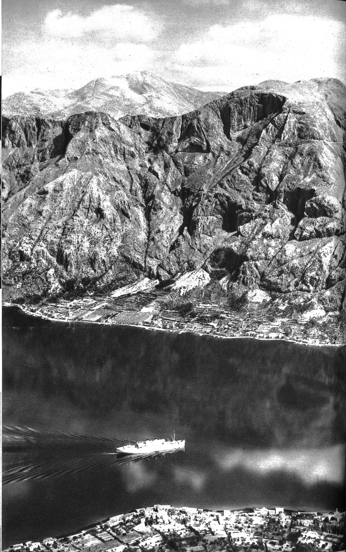
Im Küstengebiet der Borka Kotersma

Städtchen, tief hinter dem Uferfaum, in einer engen Gasse, in einem düsteren Hause zu finden, während sie drüben in dem alten Bosna saraj noch immer nicht so selten geworden sind. Die kreuzweis gesteckten Holzgitter der Haremsfenster, kunstvolle Teppiche und zifeliertes Kupfergeschirr, Opanken und Reliquien aus einer vielbefungenen türkischen, albanischen Heldenzeit. Doch in den Volksliedern leben noch die gewaltigen Män-