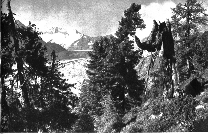
In den schönen Arvenbeständen im untern Aletschwald