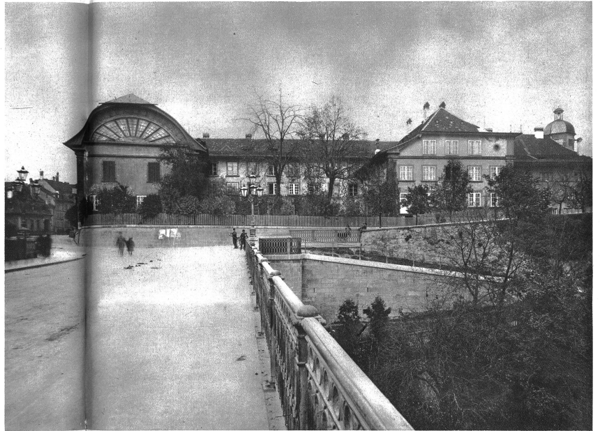
So um die Jahre 1890 befand sich die Universität Bern am Platze des heutigen Casinos. Das grosse Gebäude links war die Aula, in der Mitte das Kolleg. Der Turm rechts im Bilde dokumentiert die „Grüne Schule“, genannt auch Kantonschule oder das heutige Gymnasium. Alles ist abgerissen. An diesem Platze steht heute das . . .