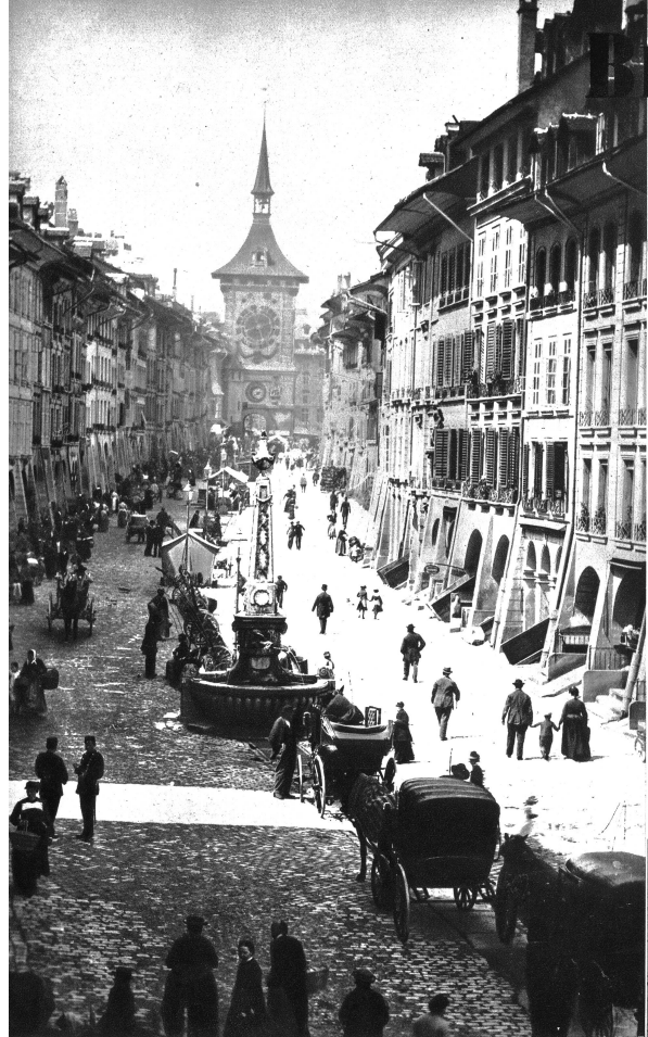
Die Kramgasse um die Jahre 1880. Gemütlich bummeln die Bewohner der „Grande rue“ wie sie französisch genannt war, auf der Gasse herum. Keine Strassenbahn, keine grünen Autobusse schlingelten sich den Häusern entlang. Die Läden der Weinkeller waren offen, auf den grünen Laubenbänken plauderten die Bernerinnen, und die Landleute hielten auf der Schattseite ihr Gemüse feil.