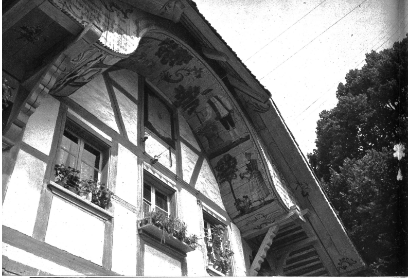
Mengestort. Bemaltes Stöckli Burren