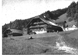
Im Grund bei Riggsberg „Paradiesstöckli“