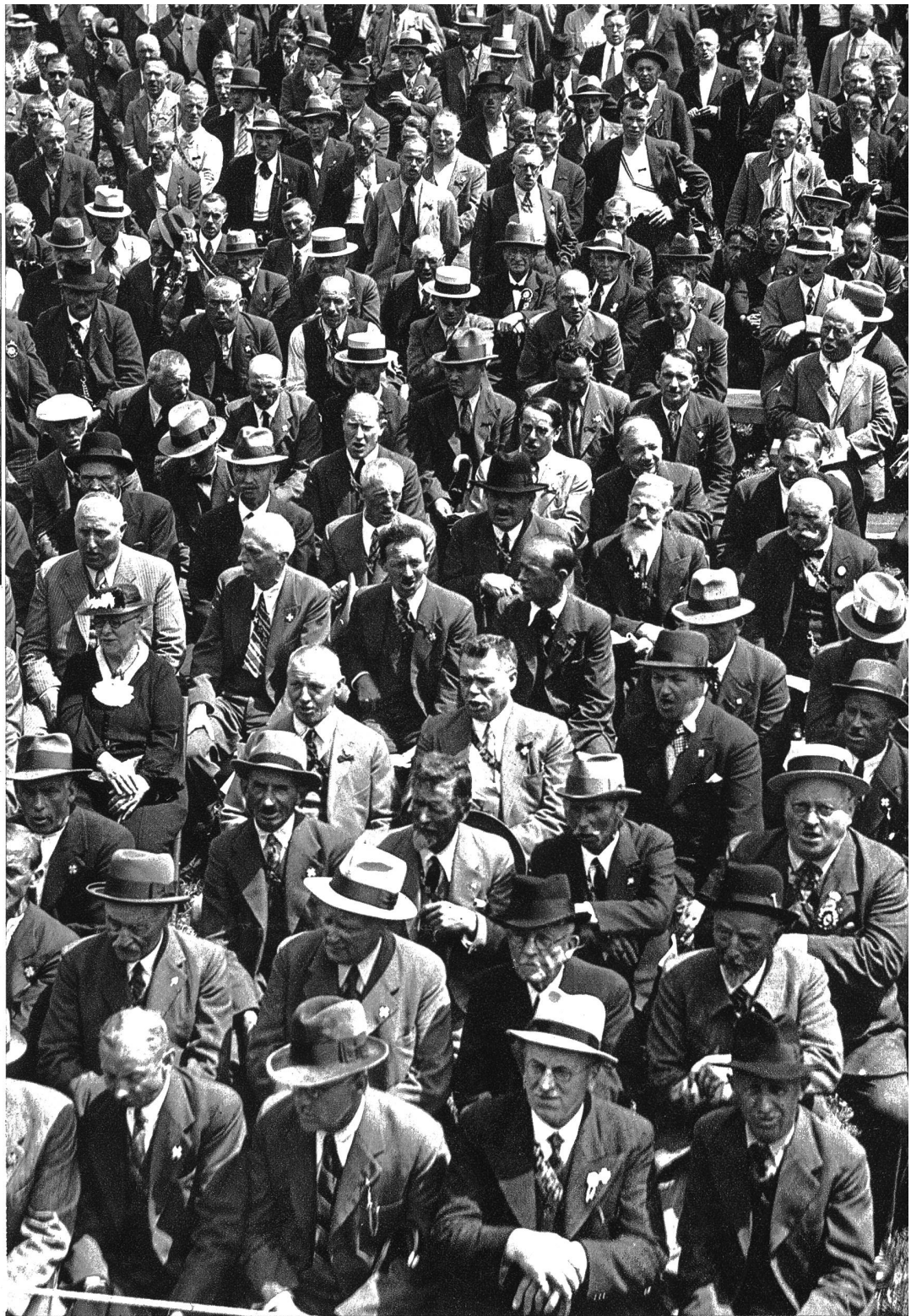
Sonntag mittags auf dem grünen Rasen der Schützenmatte trafen sich die Veteranen und Männerturner zu einer schlichten Feier, die sie mit einem kraftvollen Kantus „Wo Berge sich erheben“ eröffnen.