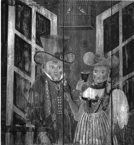
Bemalter Fensterladen von obigem Stöckli