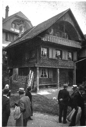
Guggisberg. Stöckli Glaus bei der Kirche wird besichtigt durch Heimatschutz-Mitglieder