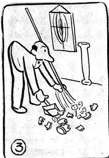
Bumps als Kunstschütze.