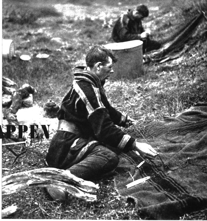
Lappen beim Flickern der Fischnetze.

Die Lappen sind keine wilden Tiere, die sich von den Fremden bedrücken lassen. Unberührt von den Menschen aus dem