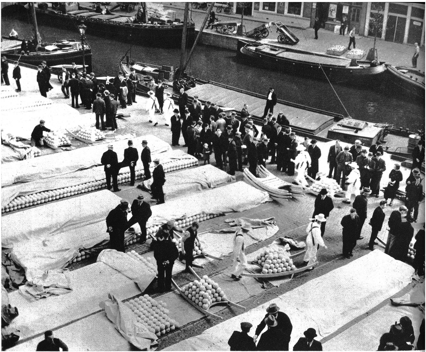
Blick auf den Marktplatz von Alkmaar, dem Hauptmarkt von Holland