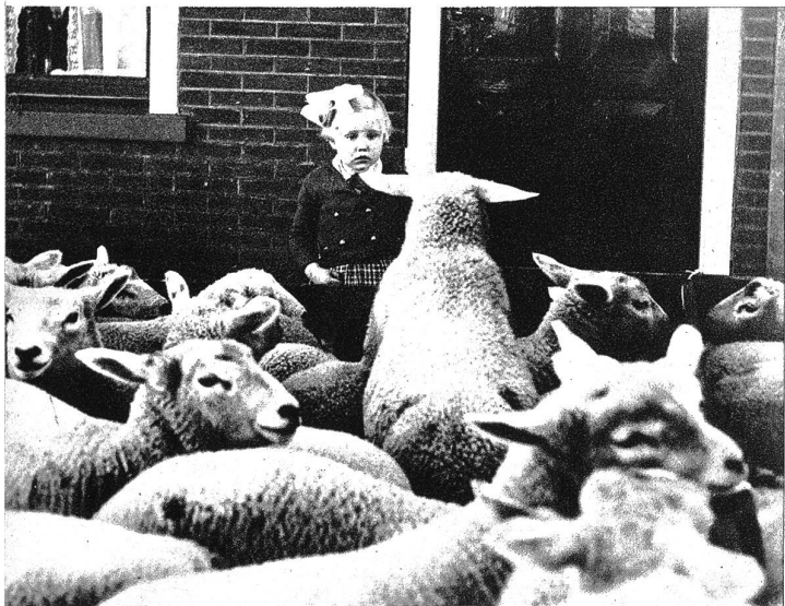
Jeden Montag findet in dem kleinen Dorfe Burg auf der Insel Texel ein grosser Lämmermarkt statt.