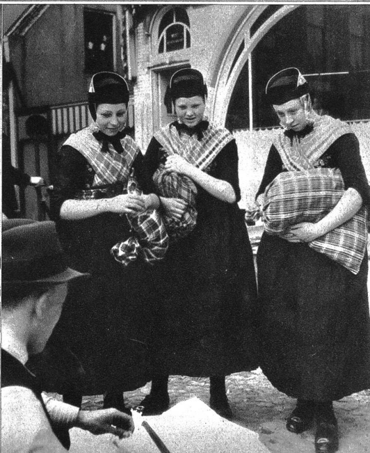
Links: Zwei Bauern im Gespräch auf dem Markt zu Goes, der wöchentlich einmal stattfindet und zu dem aus der ganzen Umgebung unzählige Bauern und Bauernfrauen kommen.