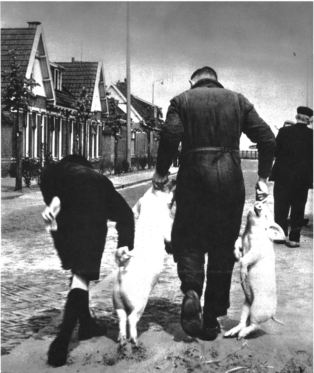
Ein Bild vom grössten Ferkelmarkt, der wöchentlich einmal in Meppel stattfindet. Die gekauften Ferkel werden von den Händlern auf diese etwas drastische Weise zu den Viehwagen gebracht.