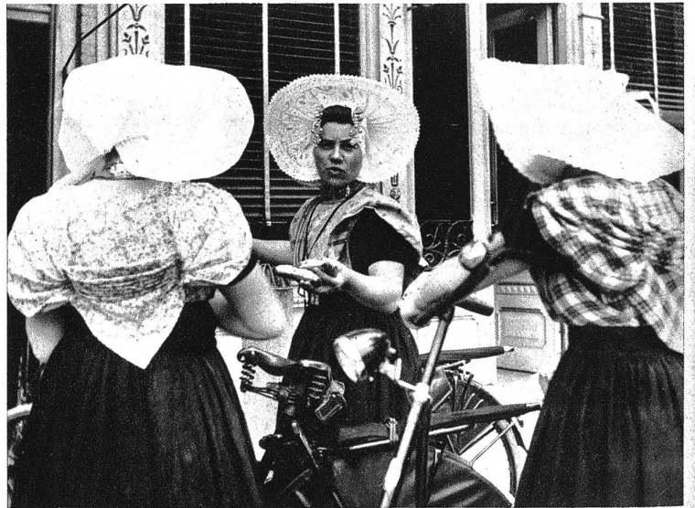
Mädchen auf dem Markt zu Goes. Mit ihren schönen Zeeländer-Trachten geben sie dem Markt ein romantisches und malerisches Gepräge.