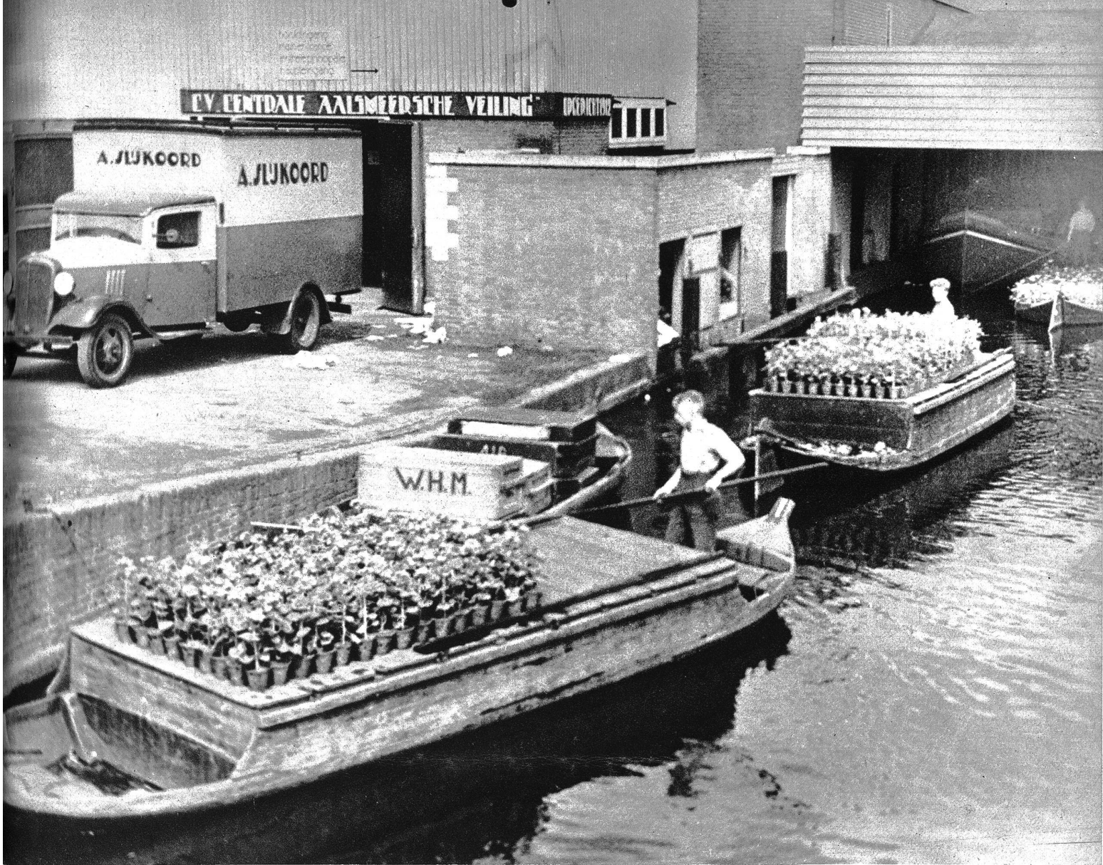
In aller Frühe kommen die Züchter mit schwerbeladenen Kähnen zum täglichen Blumenmarkt in Almeer.