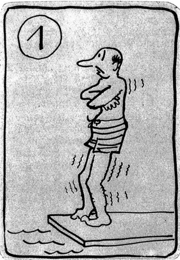
Bumps hat Bedenken.