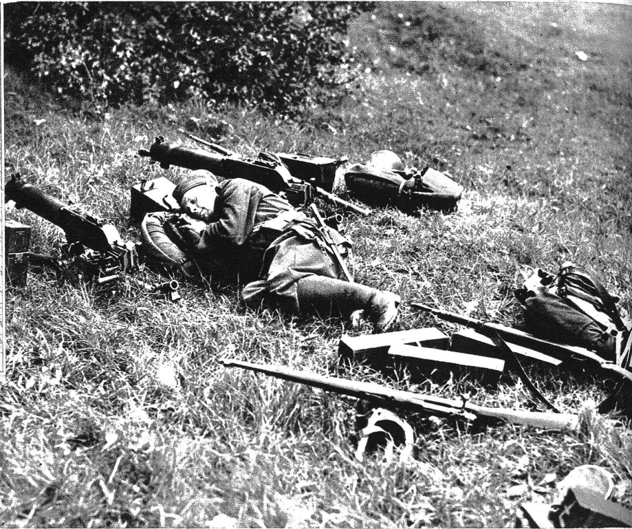
Maschinengewehrposten auf Wache Tag und Nacht. Motol, südwestlich von Prag, ist einer der Hauptverteidigungsposten der Tschechen vor ihrer Hauptstadt. Tag und Nacht in Alarmbereitschaft sind Maschinengewehr- und Flugzeugabwehrposten. Unser Bild zeigt einen Maschinengewehrposten in Motol; der Soldat auf Wacht gönnt sich eine Stunde nicht allzu bequemer Ruhe zwischen seinen zwei schweren M.-Gewehren